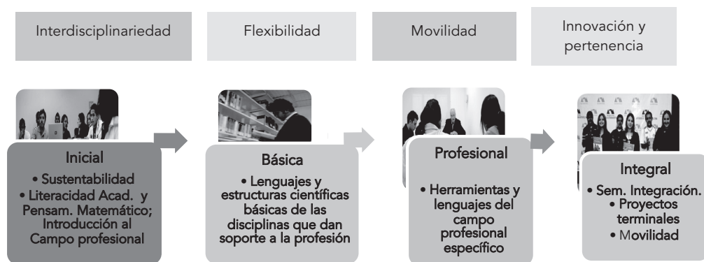
FIGURA 3. Estructura. Principios y organización por fases

Las once licenciaturas que ofrece la Unidad Cuajimalpa consideran en sus correspondientes planes de estudios las siguientes UEA: