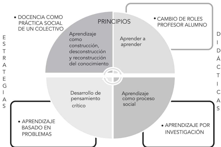
FIGURA 2. Componentes pedagógicos del modelo educativo de la UAM Cuajimalpa

La educación centrada en el aprendizaje y en el estudiante se basa en la premisa de que el conocimiento no se transmite ni existe de manera independiente de los alumnos; más bien, plantea que en lugar de adquirirlo a partir de la transmisión, lo construye a partir de sus percepciones e interpretaciones, que se moldean mediante la interacción con el entorno y los agentes educativos. Se aparta de la idea de que el profesor es quien impone la estructura de conocimientos, y más bien lo concibe como un facilitador, que promueve el aprendizaje del estudiante. El estudiante construye significados al participar en actividades de indagación, de descubrimiento de perspectivas e información relevante, mediante la interacción con compañeros, profesores, expertos y materiales de todo tipo, así como a partir de la aplicación del conocimiento como herramienta en la solución de problemas, casos, proyectos y otras situaciones significativas. En la figura 2 se muestran los contenidos pedagógicos del modelo educativo de la UAMC, mismos que se describen más abajo.